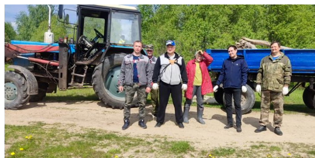
Субботник на р. Ильдь с. В-Никульское

Проведены работы по санитарной выпилке старых деревьев, а также по очистке территории под линиями