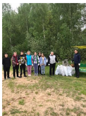
Субботник на канале

Совместно с жителями поселения, сотрудниками МКП Веретя, проводились мероприятия по наведению порядка на общественных территориях населенных пунктов, благоустраивались территории кладбищ,