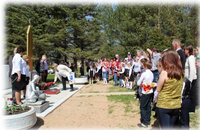
Открытие памятника, 2015 год