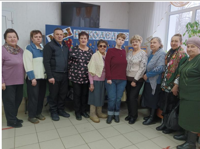
Пездка в п. Новый Некоуз