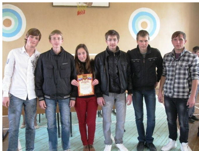
Третье место в непростой борьбе между командами «Сицкари» (Воскресенская СОШ) и «Убойная сила» (Октябрьская средняя школа), заняла команда из Октября. Все команды были награждены грамотами и дипломами за участие, команды-победители – ценными призами.