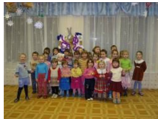
Коллектив МДОУ Борковский детский сад

украсить музыкальный зал к празднику и последующим утренникам. В результате, зал был украшен по новому, и каждый участник праздника мог по праву считать себя организатором «Новогоднего огонька». В ходе вечера были подведены итоги конкурса, проведены игры и соревнования, на большом экране был показан классический мультфильм про Новый год «Когда зажигаются елки». Все участники получили угощение, грамоты и призы.